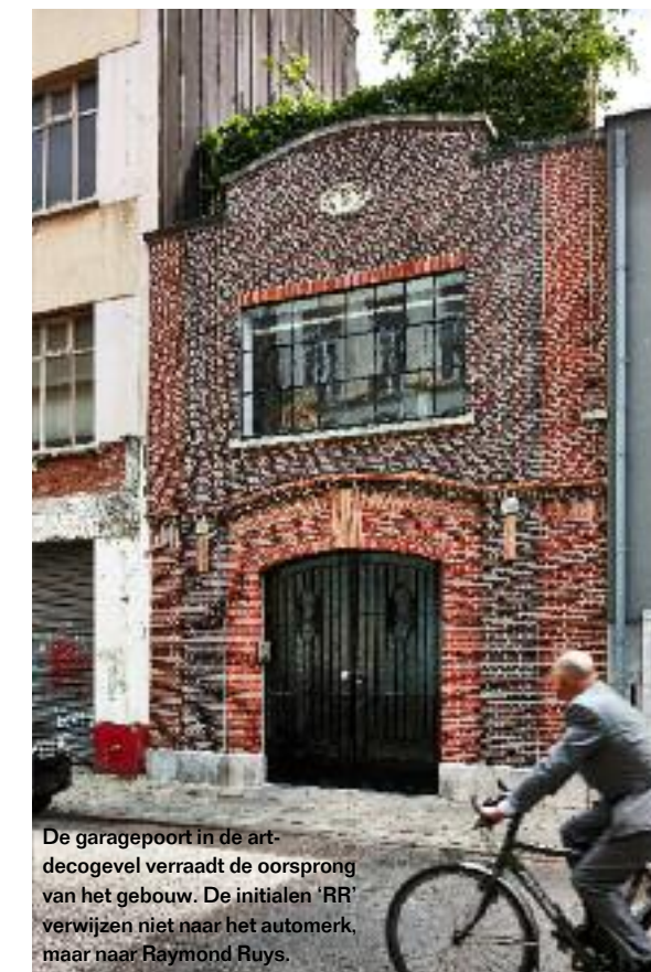
De garagepoort in de art-decogevel verraadt de oorsprong van het gebouw. De initialen 'RR' verwijzen niet naar het automerk, maar naar Raymond Ruys.